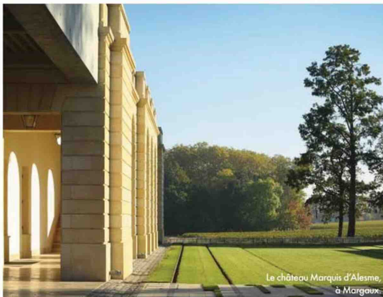
Le château Marquis d'Alesme, à Margaux.

Route des Châteaux, Pauillac (33). Tél. : 05 56 59 24 24. jmcazes.com