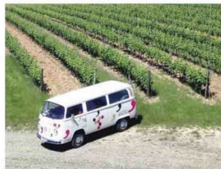
11 AOÛT 2017