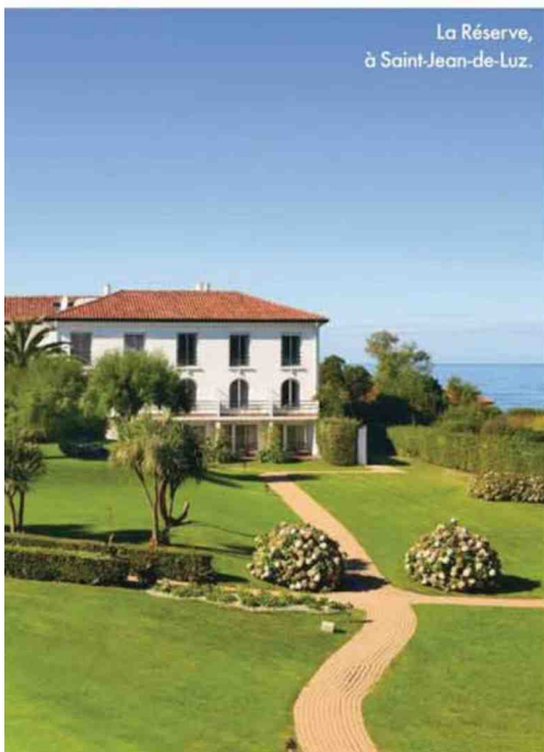
La Réserve, à Saint-Jean-de-Luz.